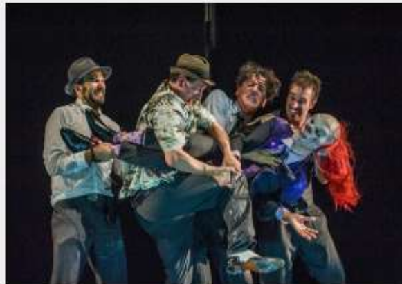
Los policías intentando detener a uno de los mafiosos.