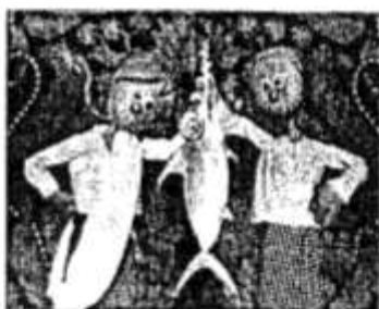
↑ 聪明的小男孩为救全村人民，挺身而出阻挡剑鱼的侵袭。