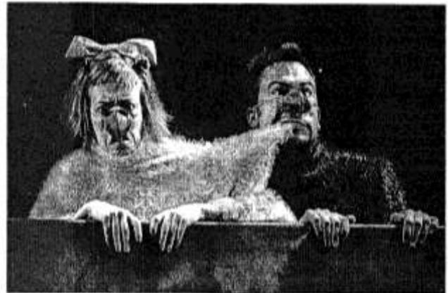
Skunka Comedy aus Spanien bieten die zwei Abgesandten des eigentlich siebtköpfigen Ensembles „Yllana“ im Georgspalast an der Rottstraße.