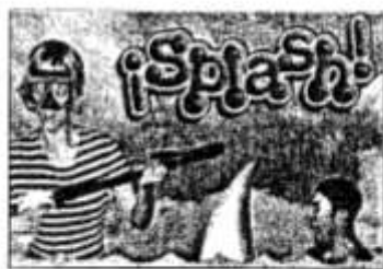
↑ 开启想像，随西班牙Yllana剧团一起展开一个惊险刺激的旅程。