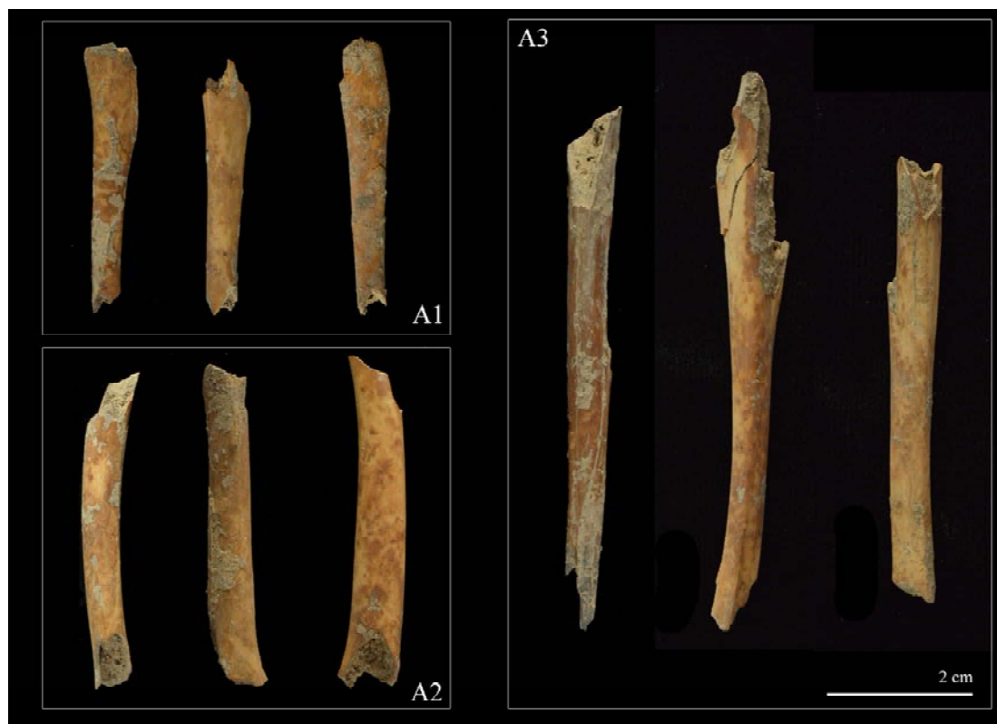
Figura 1. Cilindres diafisaris produïts sobre húmer (A1), fèmurs (A2) i tíbies (A3) en diferents nivells arqueològics del Molí de Salt.

A banda de les alteracions associades a activitat humana, algunes restes faunístiques presenten alteracions relacionades amb l'activitat de petits carnívors, tals com mossegades i digestions. Tot i que aquestes alteracions són minoritàries en el conjunt, especialment si es comparen amb les modificacions de caire antròpic, és necessari remarcar-ne l'existència. Les depressions i solcs produïts per les dents de carnívors en cap nivell arqueològic excedeixen el 2,3% de representació. Igual que en el cas de les marques de tall, solen situar-se sobre ossos de les extremitats, escàpules i pelvis. Les alteracions digestives estan presents de manera anecdòtica en el conjunt (sempre representant menys del 0,4% de la mostra), i són completament absents en els nivells B1.1 i B2 (Taula 3).