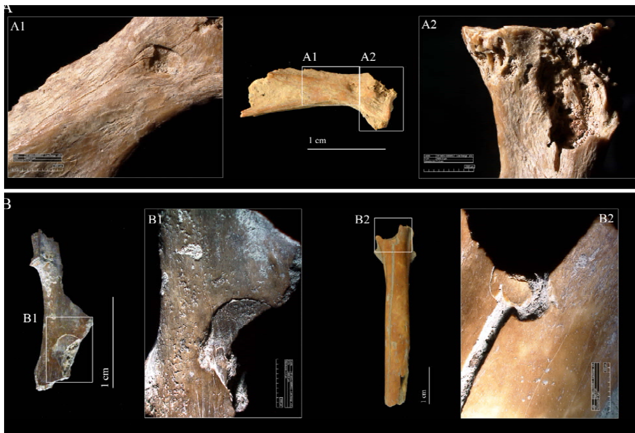
Figura 3. Marques de mossegades (A1; B1-B2) i alteracions digestives (A2) sobre ossos de conill del Molí del Salt. Les mossegades que han generat la fractura de l'os es presenten en forma d'osques (B).

D'altra banda, tot i l'existència d'activitat de carnívors en el jaciment, no s'ha de descartar la possibilitat que part de les restes que presenten mossegades puguin ser produïdes per humans. Arribar a determinar si les marques de dents deixades sobre els ossos és conseqüència de l'acció d'un o altre predador no sempre és possible, ja que tant uns com altres fracturen els ossos amb un mateix objectiu: obtenir-ne els nutrients interns. Alguns autors, han intentat determinar possibles patrons morfològics que ajudin a discriminar mossegades humanes de les generades per carnívors. Tanmateix, tots arriben a la conclusió