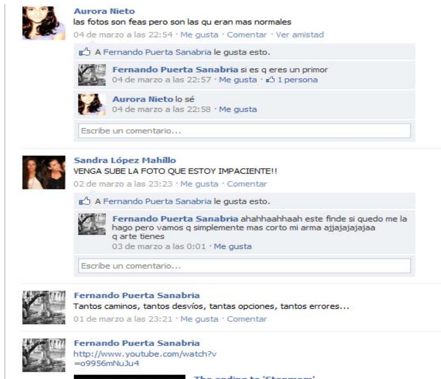
Imagen 2: Captura de muro de usuario nº 9 que representa una conversación con figuras retóricas: metáfora, repetición, insistencia, agramaticalidad, onomatopeya.

Prácticamente el resto de las diez figuras más usadas, esto es, insistencia, onomatopeya, elipsis, agramaticalidad, silencio, símbolo, hipérbaton, responde a un lenguaje contagiado por las características de la conversación oral y condicionado por el medio, es decir, caracterizado por la rapidez y la solvencia interpretativa de los participantes. Con respecto al resto de figuras: la antonimia, crasis, epanadiplosis, aliteración, polisíndeton, alegoría, alusión, antonomasia, calambur, Paráfrasis, silepsis, transcodificación y suspensión son las que solo se usan una vez en el conjunto de las 16 redes. Las demás figuras, también carecen de una representatividad importante.