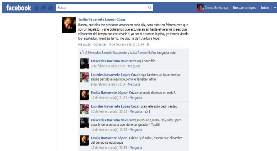
Imagen 3. Ejemplo de diversidad retórica en una conversación de muro de la microrred n° 3: se emplea personificación, interrogación retórica, insistencia, elipsis y varias metáforas ("regalazo"; "hacedor del tiempo"; "gran jefe indio"; "rollo").

En cuanto a la diversidad, el índice mayor corresponde por igual a los perfiles 1 y 2, los de mayor edad, con una media en nuestro caso de 47,3 años.