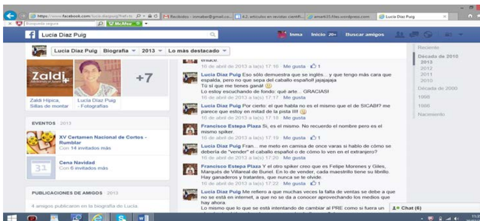
Imagen 4. Ejemplo de mayor densidad de figuras en un usuario de Facebook (usuario nº 6). En una intervención corta emplea metáfora, hipérbole, onomatopeya, insistencia, agramaticalidad, símbolo, elipsis, agramaticalidad.