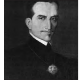
Retrato del Inca Garcilaso de la Vega.

Si el Inca quiso dejar constancia de que efectivamente la tragedia y el infortunio funcionaron tanto para su mundo materno (pues los últimos vestigios del Incario fueron aniquilados con la ejecución de Tupac Amaru y el destierro de los incas) como para el paterno (los conquistadores se extinguieron primero en sus guerras civiles y, finalmente, con la postergación a la que fueron sometidos por el poder virreinal), del mismo modo Ercilla, unas décadas atrás, quiso dejar constancia del drama de la conquista y su desintegración en el mundo colonial; aquel en el que los antiguos valores se desvanecieron en un pasado de ya imposible vigencia. Insertos en una encrucijada histórica que es la que determina el tránsito entre el Renacimiento y el Barroco, Ercilla y el Inca, aunque por diferentes caminos que divergen y se entrecruzan por la amplia senda del humanismo (que en todo caso comparten), empaparon sus obras de la enérgica amargura que significó ese tránsito; sentimiento con el que, finalmente, construyeron una imagen desengañada de la historia. En sus largas y dilatadas obras, en verso y en prosa, el relato de la conquista de América que ambos autores construyeron se vio definitiva e irremediamente penetrado por la España en la que La Araucana y los Comentarios reales se forjaron. La Edad de Hierro triunfante apagó en ellas los últimos fulgores de aquella dorada edad que sus creadores, el Inca y Ercilla, soñaron en América pero crearon desde la otra orilla.