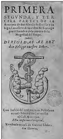
Cubierta de La Araucana . 1592.