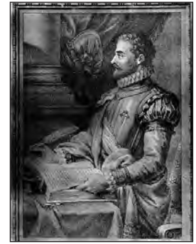
Alonso de Ercilla.